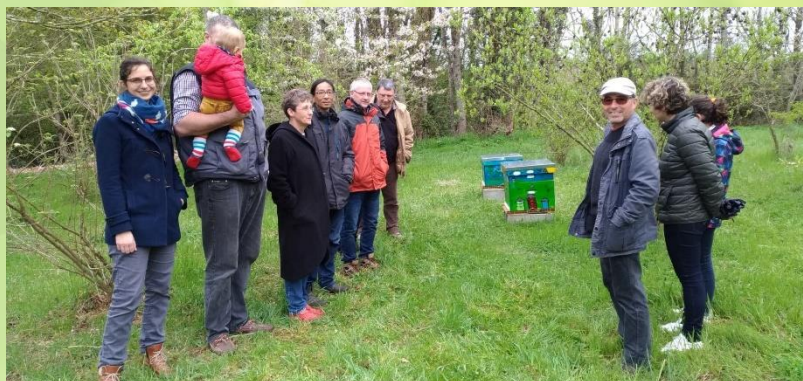
Inauguration des ruches à Jazeneuil, le 6 avril 2019.

Les huit communes ont à ce jour accueilli les abeilles dans les ruchers pédagogiques. Les animations dans les écoles débiteront très prochainement, et certaines communes ont déjà commencé les animations "village" avec des conférences, ateliers pour les enfants et expositions sur l'habitat et la biodiversité. Des projets annexes ont également été présentés à cette occasion, comme la remise de graines pour semis en pied de mur (Sèvres-Anxaumont) ou l'inauguration d'une grainothèque (Jazeneuil).